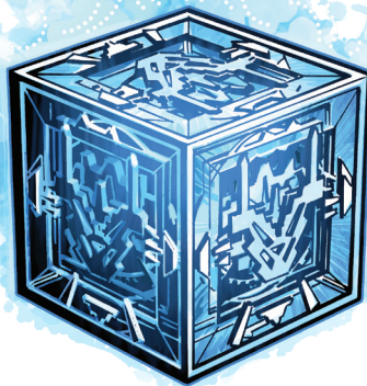
1,2 HOLOCÓN JEDI

Las transcripciones de los periodos Manderon y Draggulch incluyen principios adicionales y controvertidos, pero los Jedi sólo han de recordar las enseñanzas principales para vivir como excepcionales (pero humildes) defensores de la justicia.