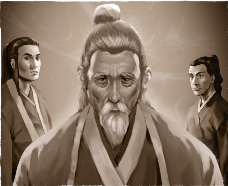
1-3 QUI-KO ES UNO DE LOS POCOS VIDENTES DE TYTHON CUYOS ESCRITOS ACERCA DE LA NATURALEZA DEL ASHLA HAN PERDURADO HASTA NUESTROS DÍAS.

¿Y QUÉ IMPORTA ESO? ¡ESTAMOS EN GUERRA! -Anakin