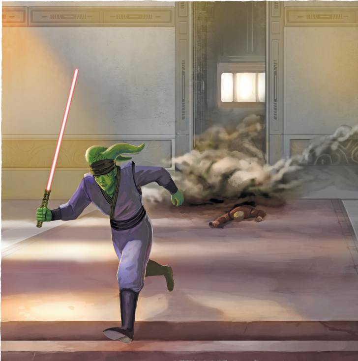
1-6 HACE MÁS DE 2.600 AÑOS, EL TRATADO DE CORUSCANT LLEVÓ A UNA TRAICIÓN DE LOS SITH Y LA ORDEN JEDI QUEDÓ DEBILITADA.

¿En serio? Parece que la filosofía del ocultamiento por parte de Darth Bane fue acertada para la época.