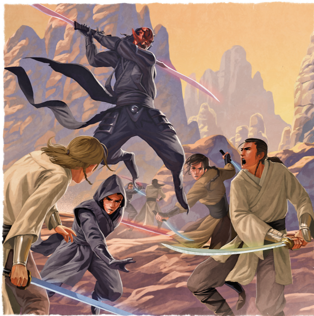
14 LAS GUERRAS DE LA FUERZA DE TYTHON, LIBRADAS CON ESPADAS FORJADAS CON LA FUERZA, FUERON LOS PRIMEROS ENFRENTAMIENTOS ENTRE EL LADO LUMINOSO Y EL OSCURO.

Las Guerras de la Fuerza se libraron con espadas cuyas hojas, potenciadas mediante la Fuerza, eran más fuertes y afiladas. Por aquel entonces, los antepasados de los Jedi ya habían descubierto lo difícil que era blandir un arma que no actuase como una extensión del propio cuerpo. Gracias a la tecnología de los visitantes de otros mundos, aparecieron las primeras espadas láser y se convirtieron en símbolos de la Orden.