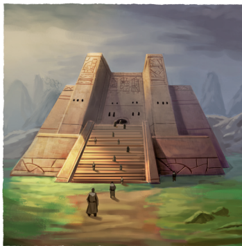
15 EL OJO DE ASHLANAE FUE EL CENTRO DE LA CULTURA JEDI EN OSSUS DURANTE MÁS DE 12.000 AÑOS.

anunció su formación pacífica en los Mundos del Núcleo, los caballeros Jedi juraron defender sus ideales de exploración, conocimiento y justicia.